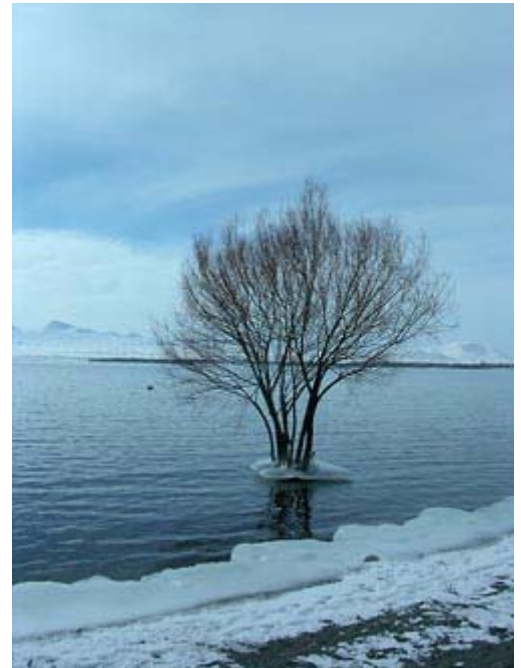
Озеро Севан зимой.

В те давние времена, еще до того, как благодаря деятельности человека резко упал уровень воды в Севане, обнажив ранее скрытые под водой территории, полуостров был одиноким обособленным островом. От берега его отделяли примерно 3 км прозрачной воды, в которой водилось много рыбы. Сиг и даже знаменитая севанская форель, в настоящее время занесенная в Красную Книгу, в те времена еще свободно резвились и плескались в прохладных озерных водах. Монашеская обитель, разместившаяся на одиноком острове, жила тихо и скромно, скрываясь за оборонительными стенами. И не был бы этот монастырь так знаменит, если бы в конце IX века тут какое-то время не жил армянский царь Ашот II, прозванный за свой сильный характер Железным, и если бы в то время к берегам озера не вышли арабы во главе с полководцем Баширом, желающие захватить эти территории.