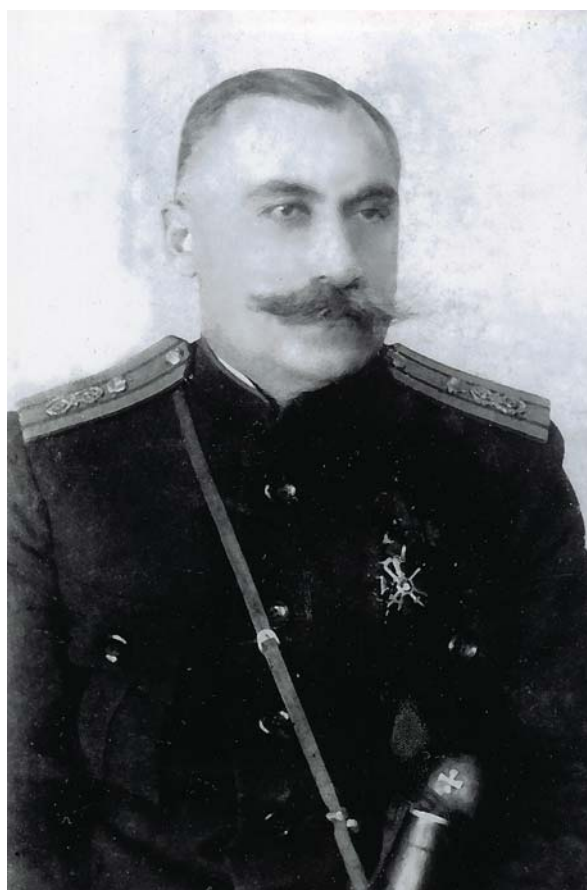
Полковник Василий Осипянец, 1916г.

По случаю утверждения пожалования Георгиевским оружием в высочайшем приказе Государя Императора от 16 октября 1916 года было сказано: